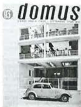
2.9 Giuseppe Terragni, Casa Rustici, Milan, 1933–35.

The Mediterranean is large and its shores along the coasts of Morocco, Spain, France, Sardinia, Sicily, Italy, the Tyrrhenian and the Adriatic, Greece, Anatolia, Palestine, Egypt, Libya, Tunisia, and Algeria have washed over many different histories, civilizations and climates. 81